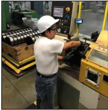
GIMAX社製の精密巻取機により、高品質の多層巻き溶接スプールを製造します。