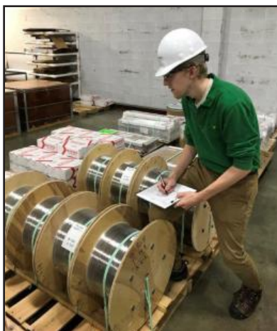
GTAW 用ワイヤは、出荷前に精密切断され、正しい合金であることを確認されます。