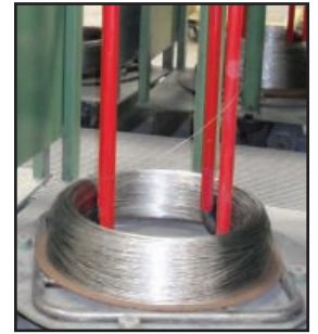
標準径のワイヤをルーズコイル形態で製造できます。非標準サイズが必要な場合は、営業部にお問い合わせください。

全ての商標は、Haynes International, Inc. に帰属します。