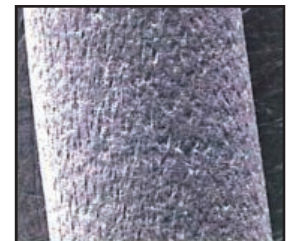
典型的な溶接ワイヤ