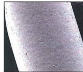
ヘインズの RTW™ 溶接ワイヤ